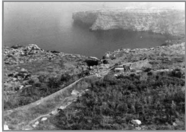
Il- Harq tal-Mejda magħluq bix-xibka biex il-fenek ma jgħaddix