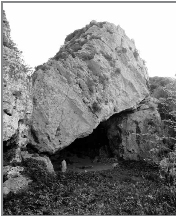
Il-Ħnejja fejn ta’ Kamiza u shabhom kienu jintefgu għall-frisk

Meta jżarmaw għall-ħdax ta’ filgħodu kienu jintefgu taħt il- Ħnejja għall-frisk, jaqlu xi zewgt